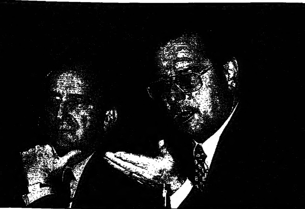
وزير الخارجية الألماني كلاوس كينكل والى يساره للنائب الدولي الأعلى في البوسنة كراوس وستندوب لدى مشاركتها أمس في مؤتمر صيفي بون

بون - أ. ف. ب. - أكد مصدر دبلوماسي أن جميع ممثلين الصرب غادروا صباح أمس الاجتماع الذي يقيم في بون حول البوسنة قبل التوقيع على الاتفاقية التي تقرر منح المواطنة لـ 100 ألف صربي. وقال مصدر دبلوماسي إن الاتفاقية التي تقرر منح المواطنة لـ 100 ألف صربي. وقال مصدر دبلوماسي إن الاتفاقية التي تقرر منح المواطنة لـ 100 ألف صربي.